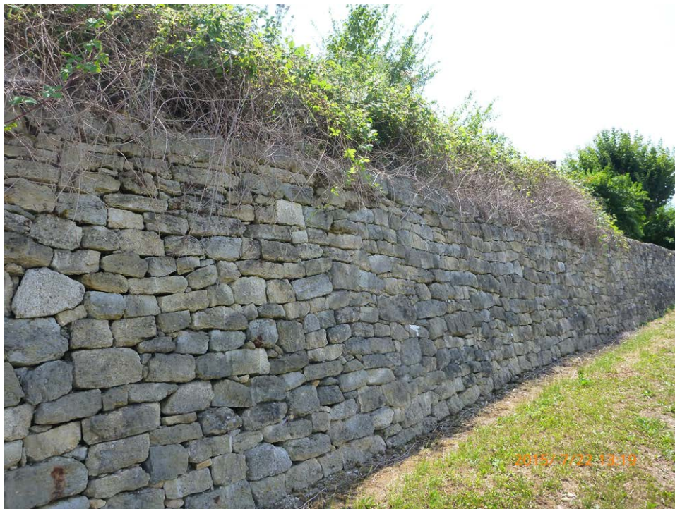
Photos de l'objet 22.07.2015